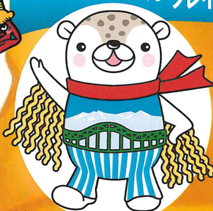
旭川市シンボルキャラクター